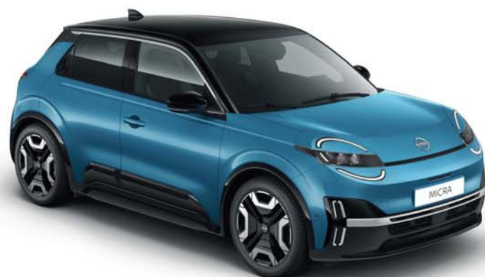
TWO-TONE CON TETTO NERO

[1] Dotazioni disponibili su determinate versioni, di serie o solo in opzione (a costo aggiuntivo).