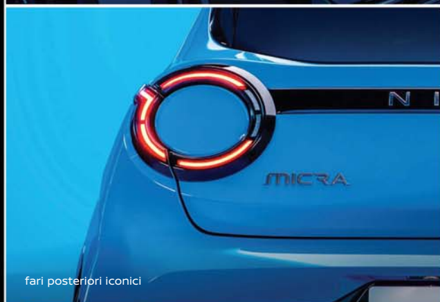
fari posteriori iconici