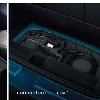
contenitore per cavi*

Design esterno | Tecnologia | Interno | Performance | Personalizzazione