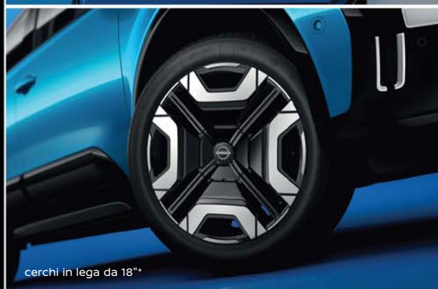
cerchi in lega da 18"