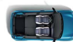
CAPACITÀ BAGAGLIAIO CON SEDILI RIPIEGATI FINO A 1.106 L