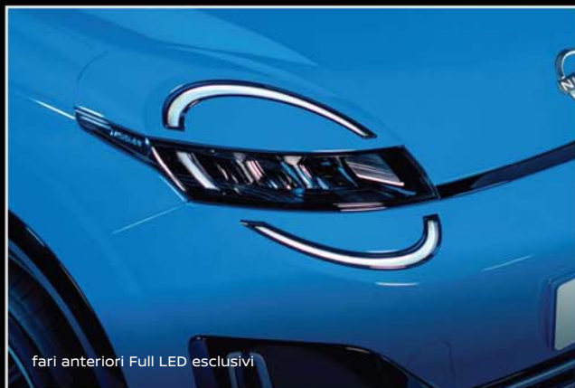
fari anteriori Full LED esclusivi