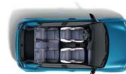
CAPACITÀ BAGAGLIAIO FINO A 326 L